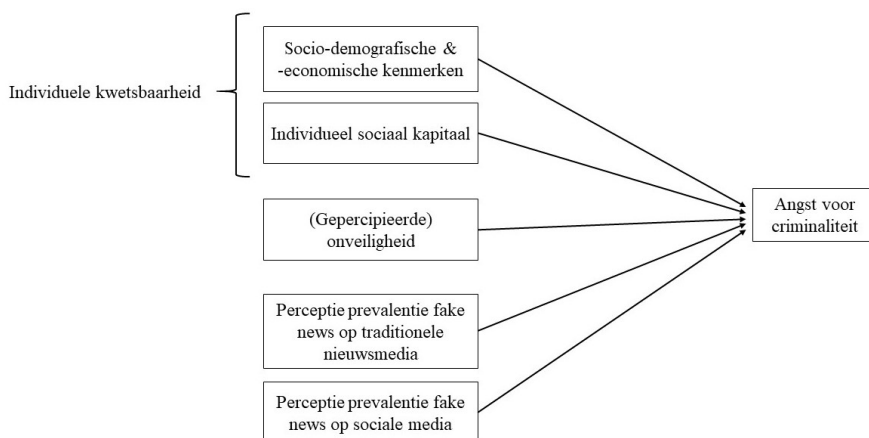
Figuur 1 Conceptueel model met angst voor criminaliteit als afhankelijke variabele

Traditionele nieuwsmedia hebben zo goed als allemaal sociale-media-accounts en delen hun nieuwsberichten ook via die weg. De sociale media zijn niet meer weg te denken uit het dagelijks leven en worden door heel wat mensen als primaire informatiebron gebruikt. De sociale media zijn vaak gratis, snel en het is eenvoudig om nieuws te delen en te becommentariëren (Shu et al., 2017). Voorgaand onderzoek toonde aan dat een hoge mate van sociale-mediaconsumptie significant gerelateerd is aan meer angst voor criminaliteit en deze relatie varieert afhankelijk van de eigen veiligheidspercepties (Intravia et al., 2017). Om deze redenen worden kenmerken van online gedrag en kennis mee opgenomen om na te gaan of deze een positief effect hebben op de gepercipieerde prevalentie van fake news (zie figuur 2 en 3). Daarnaast wordt ook nagegaan of de gepercipieerde prevalentie van fake news op het ene platform (traditionele media of sociale media) een effect heeft op de